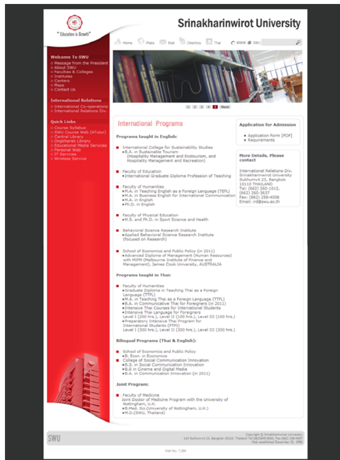
เว็บไซต์ มศว ฉบับภาษาอังกฤษที่ได้ปรับปรุงล่าสุด วันที่เริ่มเผยแพร่ 29 มิถุนายน 2553